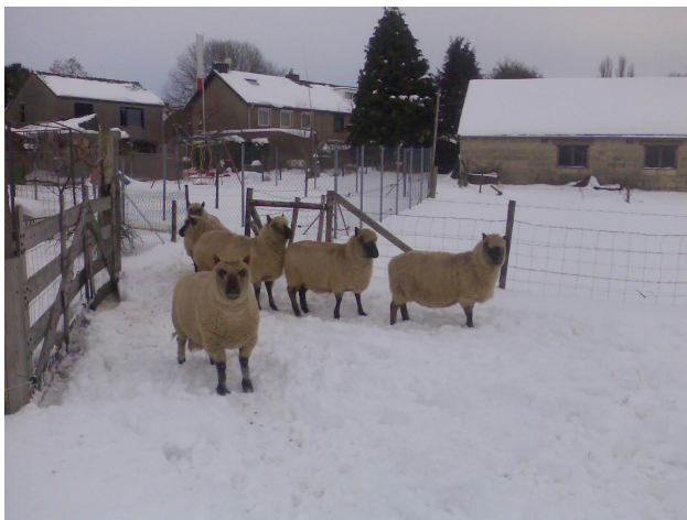
Mijn schaapjes in de sneeuw

Dit ook omdat mijn zwager ook schapen had.