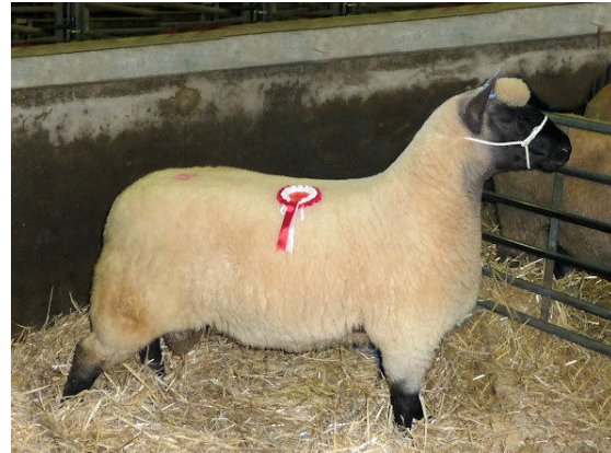
Foto's: links schapen bij de fam. van den Ouden in Hazerswoude. Rechts: een jaarling ram van Mike Eckley uit Engeland. Deze ram won de eerste prijs bij de jaarling rammen op de jaarlijkse Clun Forest ram sale in Ludlow.