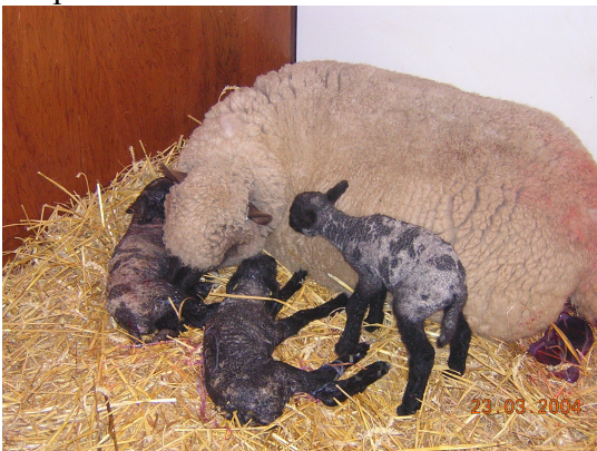
De eerste 3 drieling

ooi en begint te lachen en deelt mij mee dat de ooi aan het lammeren is en dat we ze alle vier beter in een aparte stal kunnen zetten, zodat ze rustig kunnen lammeren. Zo gezegd zo gedaan. twee in de stal, een in het tuinhuisje en een in de garage. Of het zo moest zijn hebben die avond twee ooiën gelammerd. Dit was voor mij een hele ervaring en goede leer. Twee dagen later moest de ooi in de garage lammeren. Een lam was geboren en de ooi was daarna alleen maar aan het persen en het werken. Er was iets maar ik wist niet wat. Snel opgezocht hoe een lammetje geboren moest worden. Toen een doktershandschoen aangedaan en bij de ooi gaan voelen hoe het volgende lam erbij lag. Ik voelde 3 pootjes en een kop. Dus heb ik het lam er voorzichtig uitgetrokken en bij de ooi gelegd. Ik zeg tegen mijn vrouw dat we nog even moesten wachten op de nageboorte. Nou binnen 2 minuten was deze er, alleen het vreemde was dat deze bewoog. Toen bleek: dit was een 3 e lam. Nou dat was mijn eerste eigen "bevalling". Ik heb s' nachts om 2 uur nog lekker een fles bier gedronken op de goede afloop. Dit was mijn eerste ervaring met de schapen.