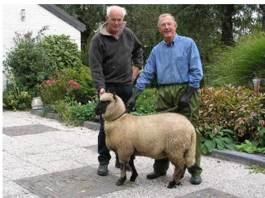
[Ramlam voor vertrek naar Wales]