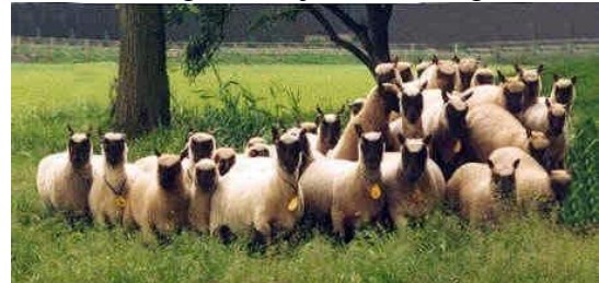
Onze kudde in 1997

Tegenwoordig is het aantal weer iets geslonken. Op dit moment hebben we 14 oaien en 2 jonge rammen.